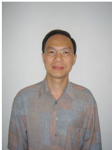
Hien-Giang 06.09.59 Druckausrüster